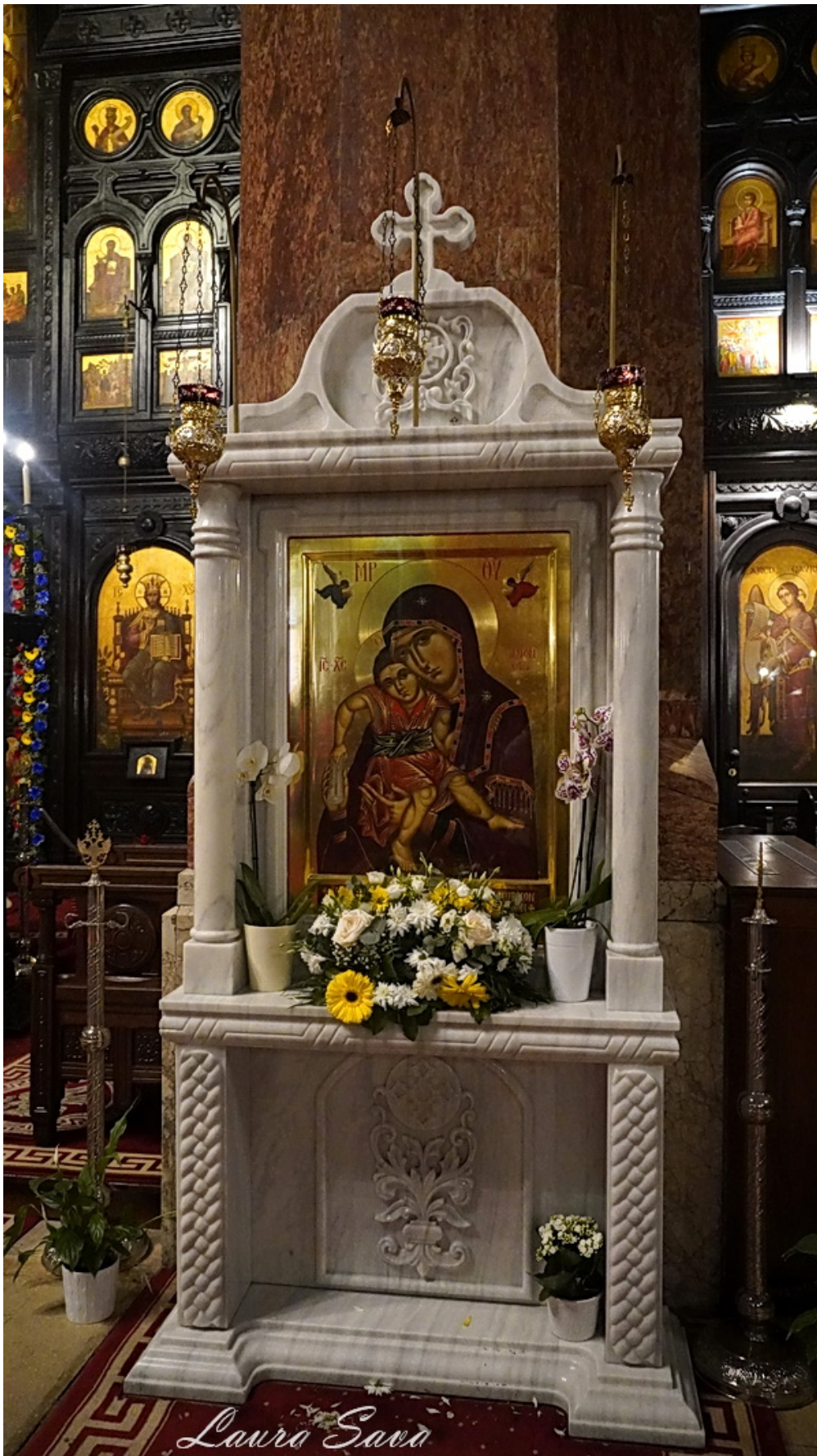
Sfintii Arhangheli Mihail si Gavriil: