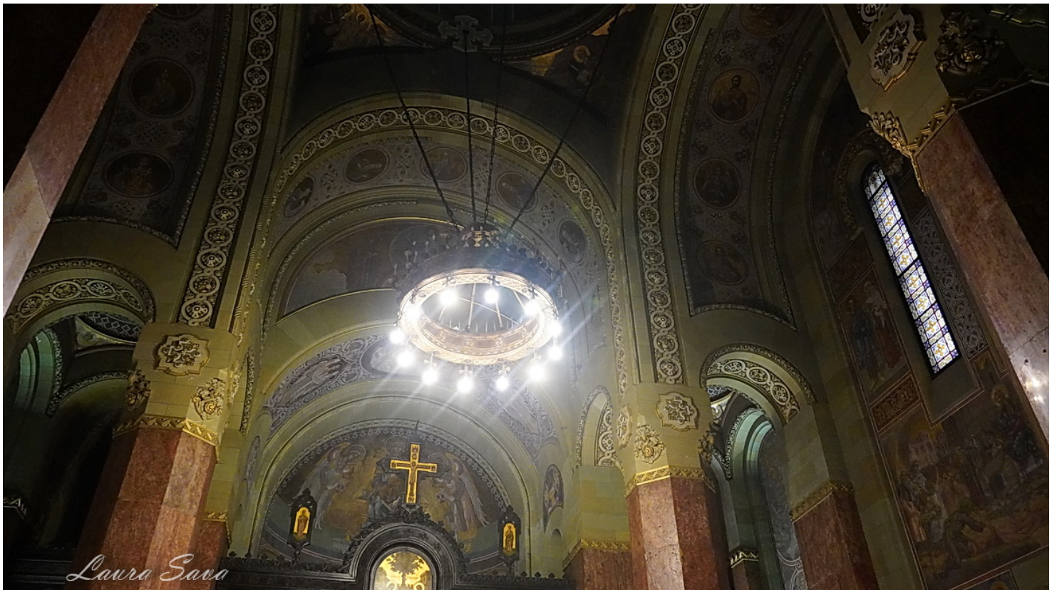
Maica Domnului cu pruncul (Axion Estin):