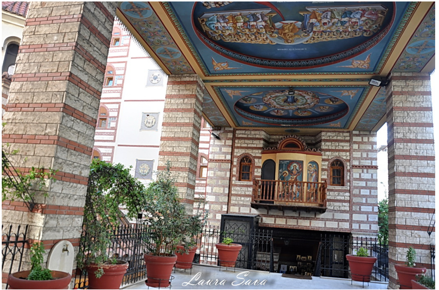
Poza facuta afara din manastire, pe strada...