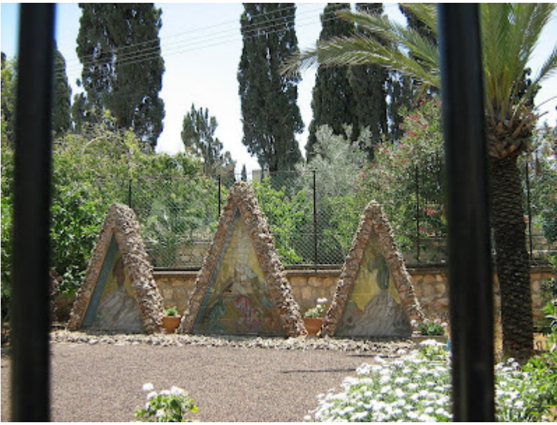
Momentul Schimbarii la Fata: