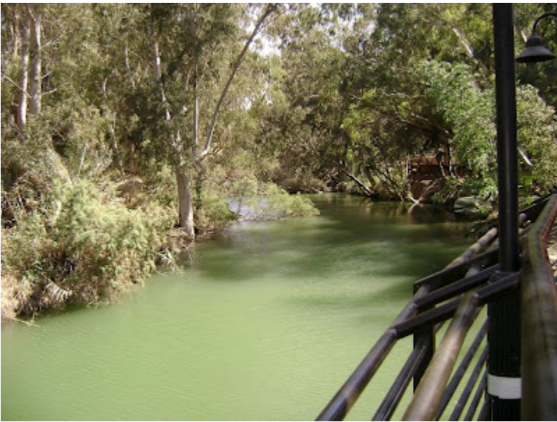
Plecarea de la raul Iordan...