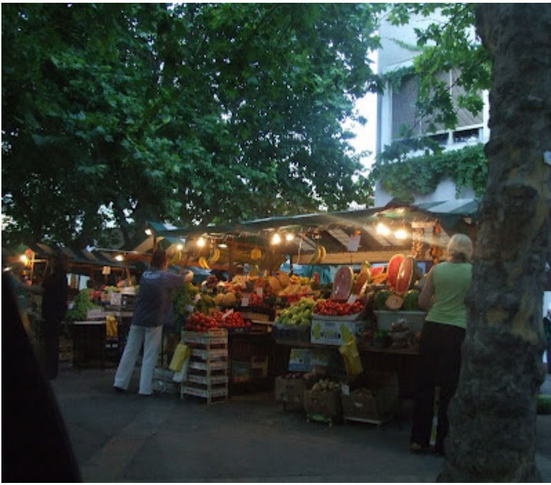
Jucarii si suveniruri...