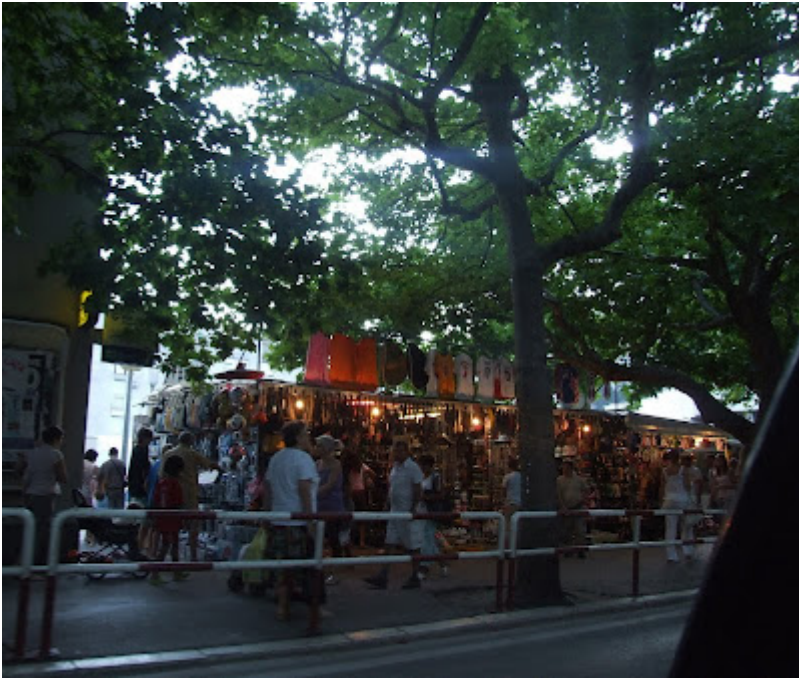
Parcul de distractii vazut de pe pod...

...o poza in care apare trambulina, inca ademenitoare pentru puiul meu iubit ☺