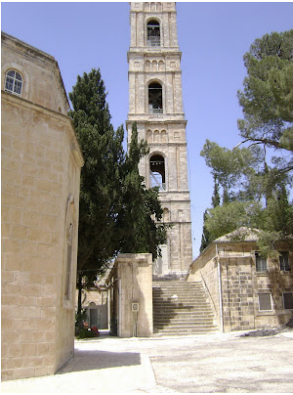
Fantana cu apa sfintita: