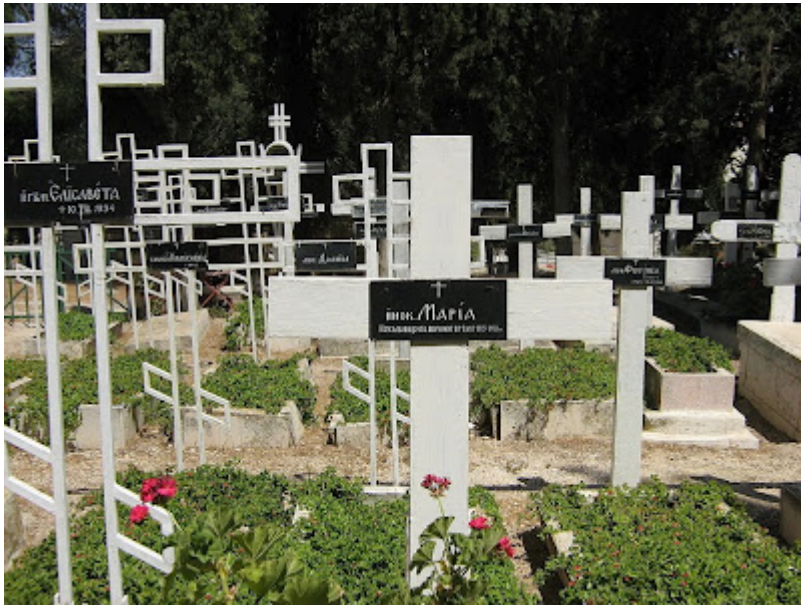
Capela Inaltarii Domnului: