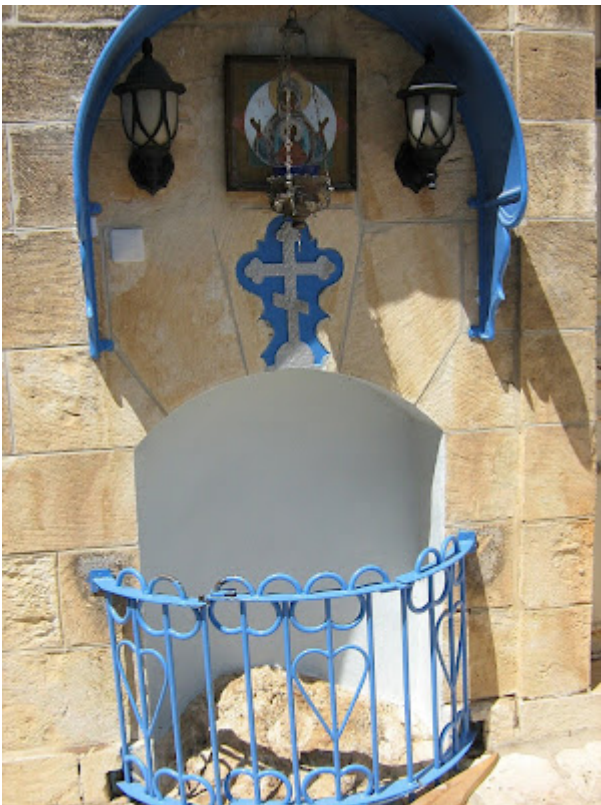
Biserica ruseasca Maria Magdalena ce adaposteste locul ingroparii capului Sfantului Ioan Botezatorul: