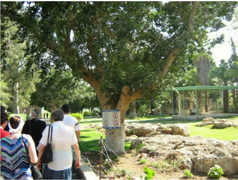
Arbori de cauciuc: