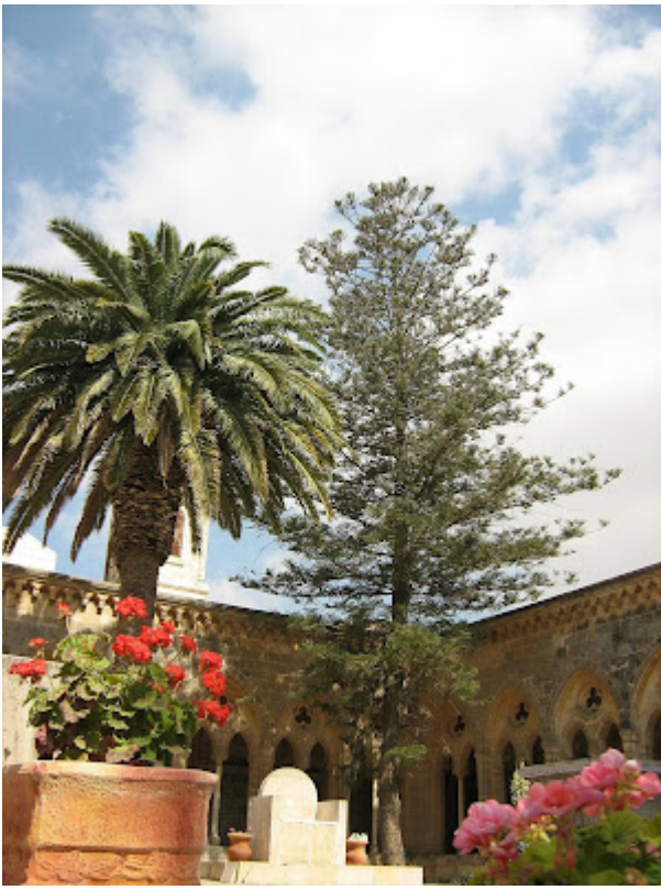
Cateva panorame ale Ierusalimului...