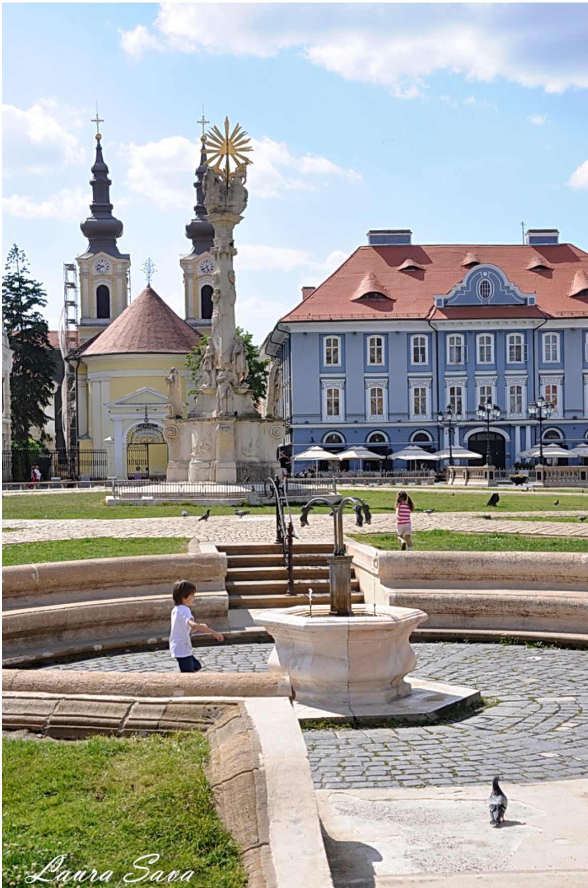
Monumentul „Sfanta Treime”, cunoscut si ca „Statuia Ciumei”, coloana ce aminteste de incetarea epidemiei de ciurma din Banat (anii 1731-1738) in prim-plan. In spatele ei se zarestie Domul