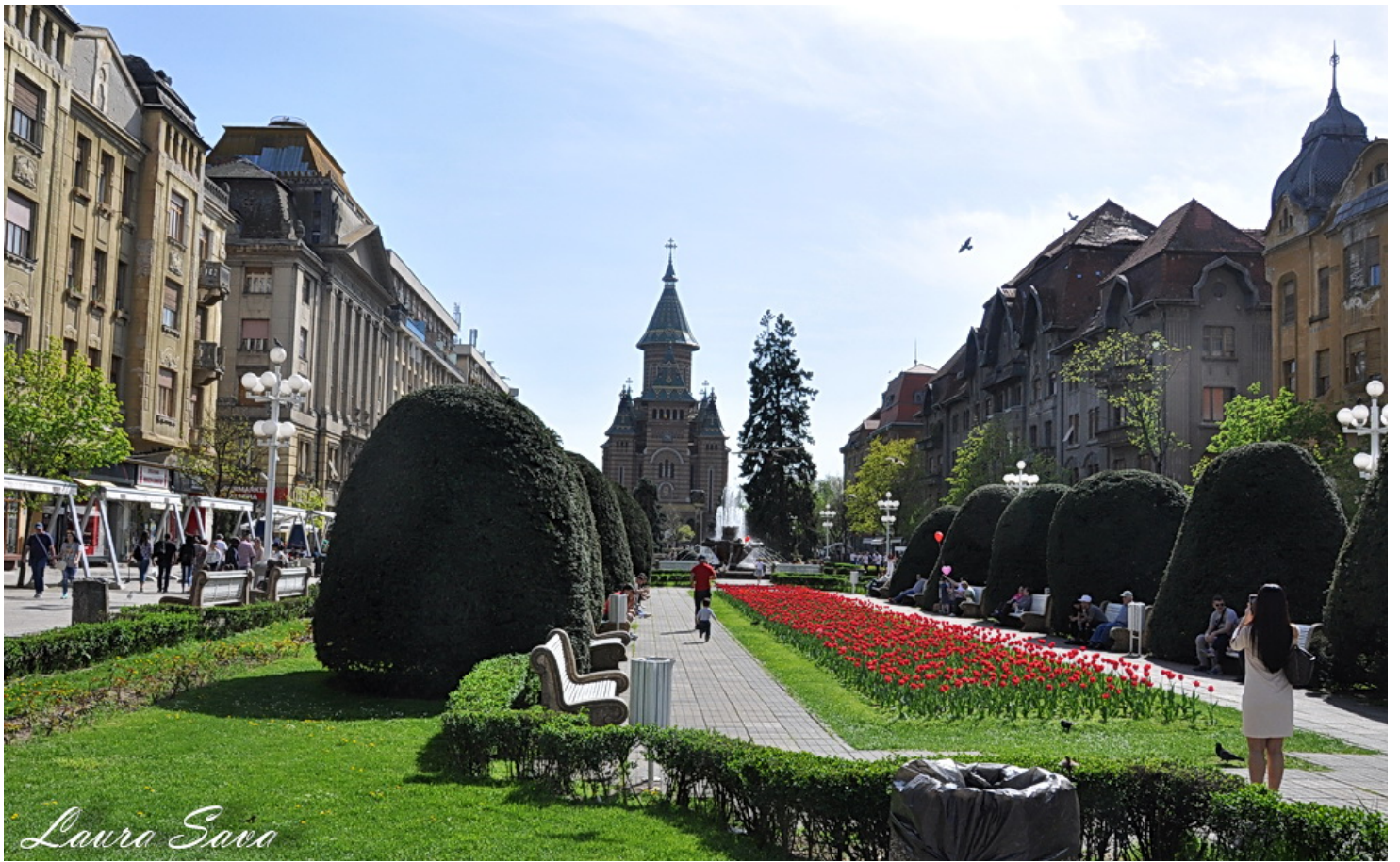
Fantana cu pesti: