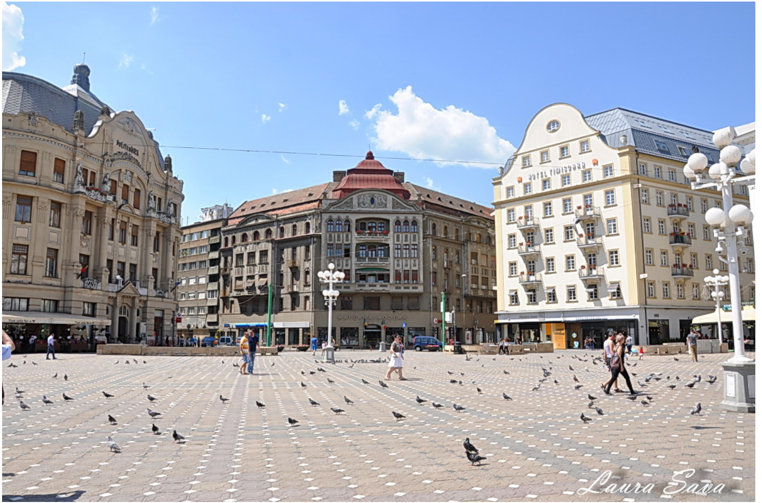
Fantana cu porumbei: