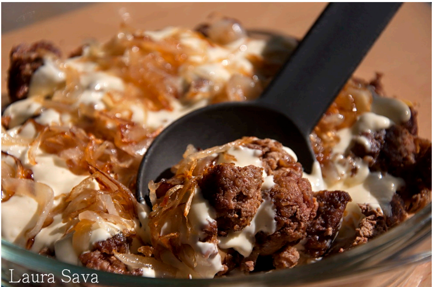
Reteta preluata de la Seima