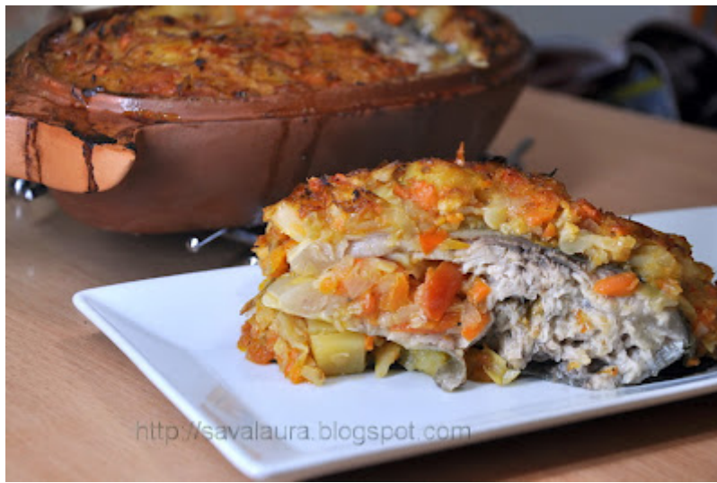
Stiuca la cuptor: 2009/01/stiuca-la-cuptor.html