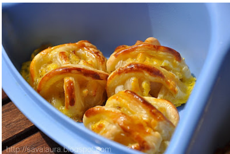
Chiftelute de peste: 2010/12/chiftelute-de-pestela-cuptor.html