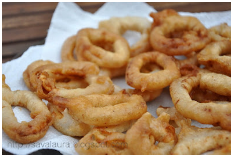
Chiftelute crocante, prajite, invelite in foi de placinta: 2011/05/chiftelute-crocante-de-batogcod.html