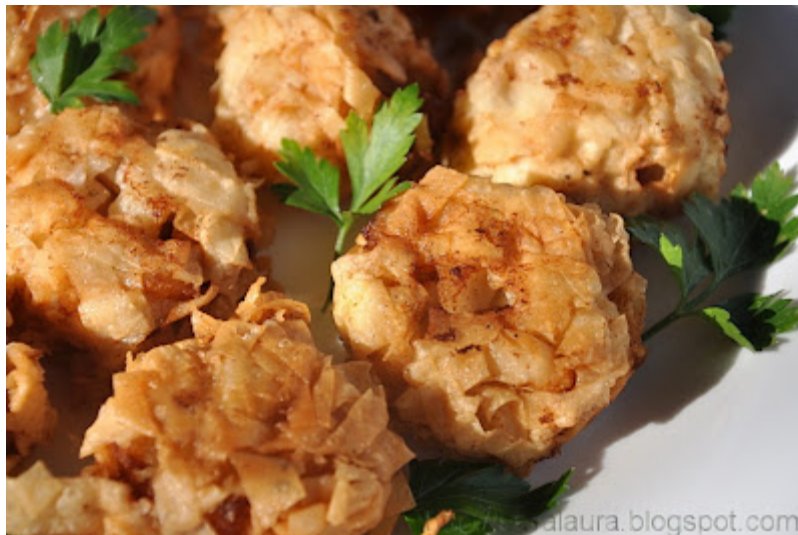
Chiftelute de peste la cuptor, in fasii de aluat (foitaj): 2011/05/chiftelute-de-pestela-cuptor.html