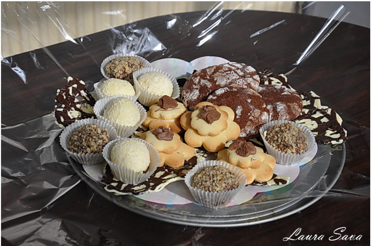
Cosuletul ambalat (in el se regasesc trufele cu Nutella, Raffaello,