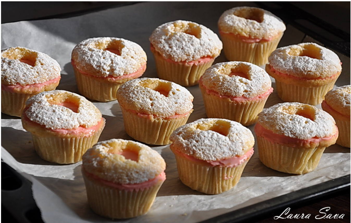
Brioșe inimioara, pentru voi!!!! <3