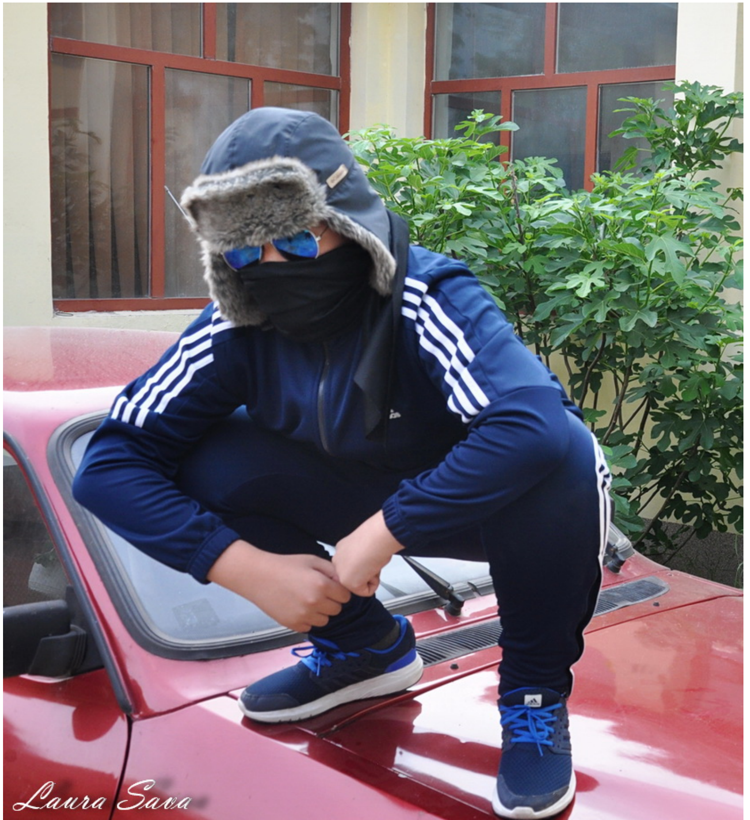
Cu Rafi lui iubit <3