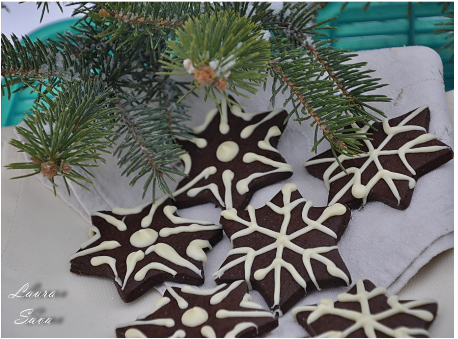
Fulgi de nea ☐