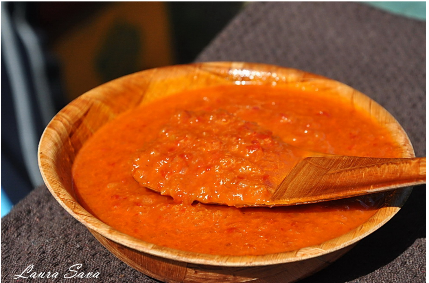
Pozele vechi □