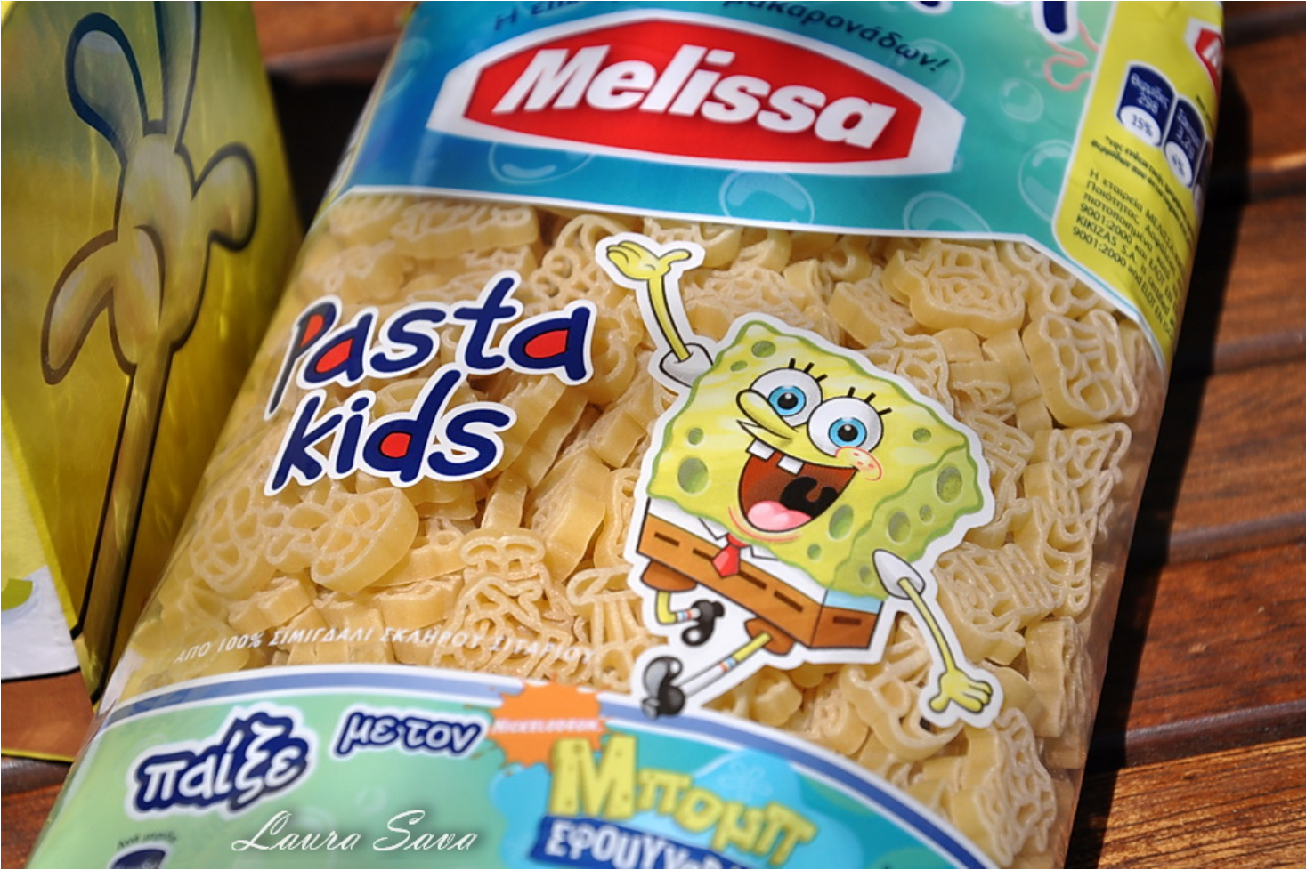
Poze cu pastele vedeta □