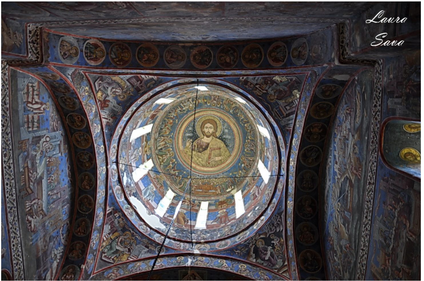
Sfantul Grigorie Decapolitul: