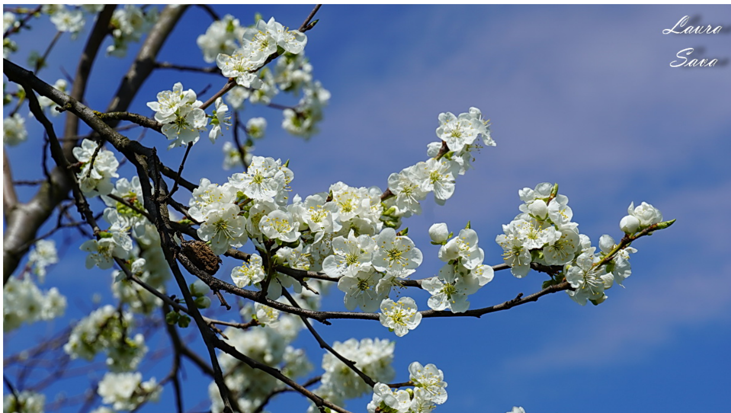
Cirese verzi, flori de gutui imbobocite si iorgovani parfumati (liliac):